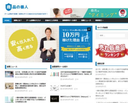
「商人の番人」トップページ