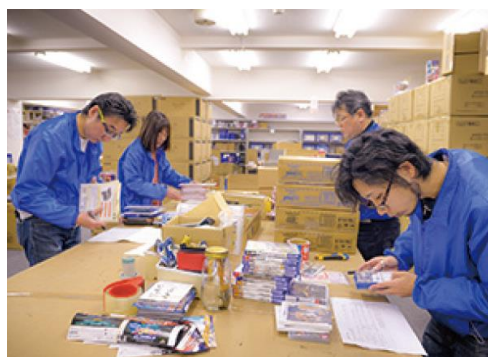
仕入れ・検品の風景